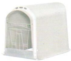
250344 Запирающиеся ворота

Все ограждения имеют 2 отверстия для кормления и стандартно поставляются с одним кольцом для ведра.