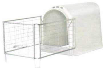
250309 3-х створчатая ограда

Ворота удерживают теленка внутри домика. Эти ворота держатся на петлях домика и легко открываются одной рукой.