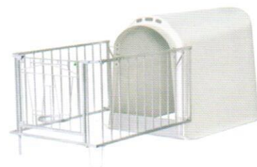
250301 4-х створчатая ограда

Ограничитель из 3 частей складывается, обеспечивая быстрый и легкий доступ к теленку.